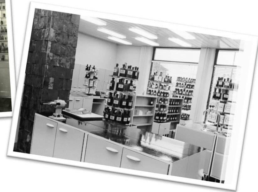
Příklad naskenovaných fotografií

Celkem 901 převážně černobílých snímků v digitální podobě, umístěno na nosičích DVD, zpřístupněno vyučujícím v knihovně ÚAF FaF pro další využití k tvorbě výukových opor.